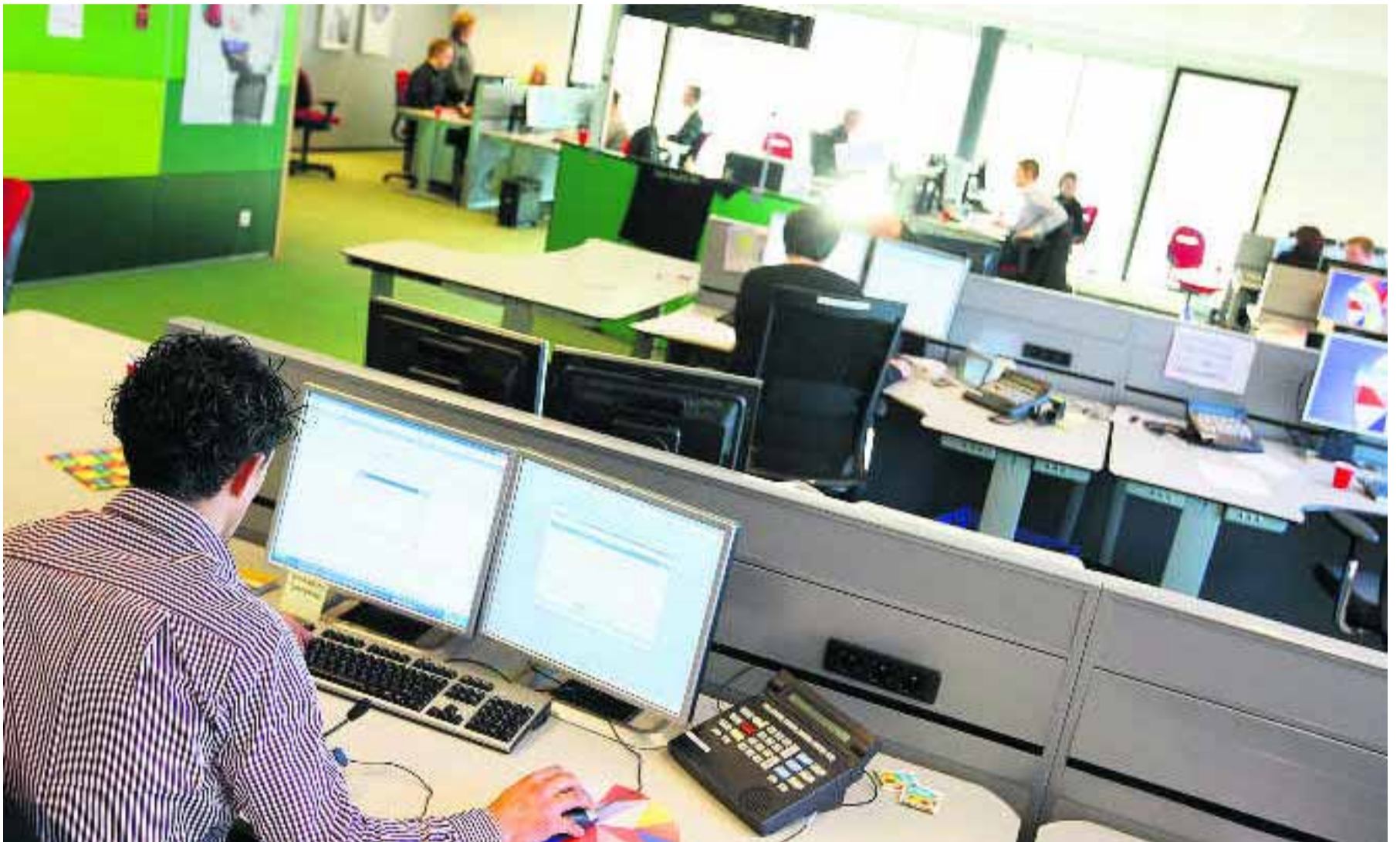
SNS Klantenservice, de spil tussen alle geledingen van de nieuwe SNS Bank, wordt 8 januari feestelijk geopend.